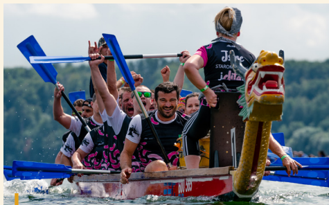
Do Festivalu dračích lodí na Slezské Hartě se zapojilo 32 dvaadvacetičlenných posádek.