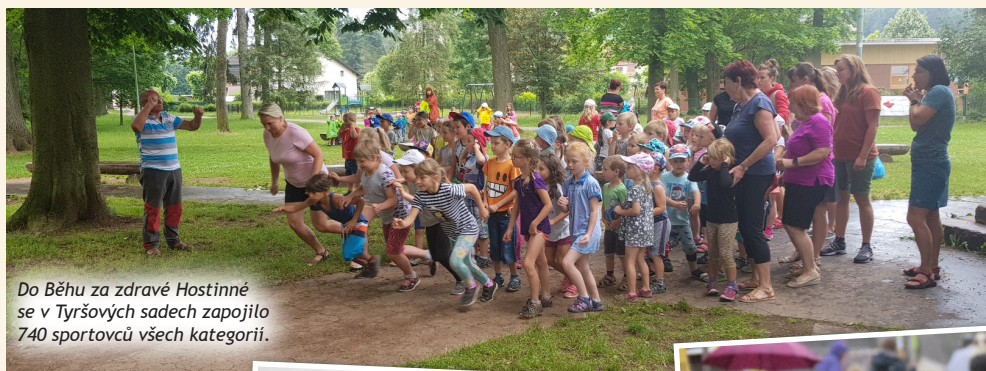
Do Běhu za zdravé Hostinné se v Týršových sadech zapojilo 740 sportovců všech kategorií.