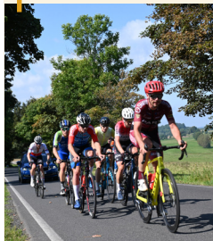
Cyklistický závod Tour de Zeleňák v Rumburku přilákal na start rekordní účast 800 účastníků.