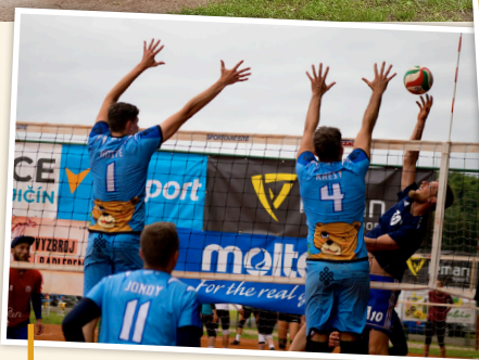
V pořadí 68. Volejbalová Dřevěnice dopadla po roční přestávce na výbornou - pod vysokou síť se představilo 172 týmů a 1 350 hráčů.