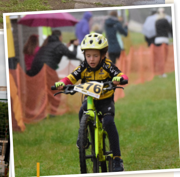
V rámci Velké ceny Vimperka horských kol se konaly také soutěže v dětských kategoriích.