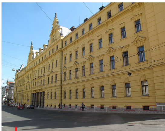
Budova Městského soudu v Praze