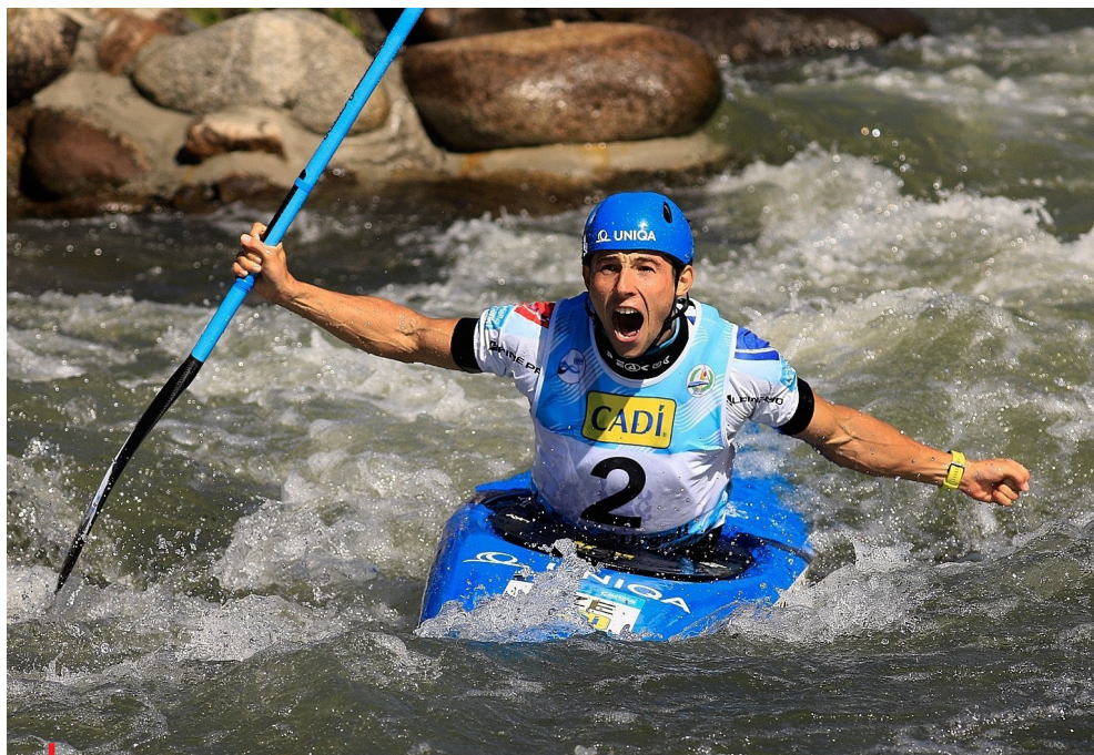
Mezinárodní úspěchy v českém sportu sbírají především zástupci individuálních disciplín.

no a schváleno státem. Stát se k tomu zavázal a neplní to! A k tomu, aby to plnit začal, potřebujeme mít jasnou hlavu, co to řídí. A MŠMT to rozhodně není. Stačí se podívat na brutální amatérismus v jejich konání v minulých letech. Vyšel na povrch i díky soudu, který mě nedávno zprostil všech nesmyslných obvinění v takzvané dotační kauze. Mimochodem tohle je obrovská ostuda českého státu, který i tímto sportem jednoznačně poškodil.“