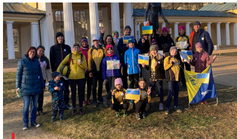
Mariánskolázeňský Orientační klub uspořádal Mločí orientáku pro Ukrajinu

Výše nasbíraných příspěvků od účastníků v průběhu těchto aktivit předčila očekávání - k 9. březnu bylo na účtu přes 420 tisíc Kč. Výkonný výbor