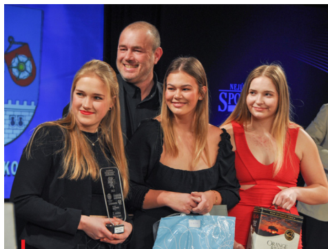
Nejlépeším kolektivem Strakonicka se staly vodní pólistky TJ Fezko Strakonice