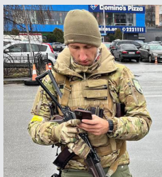
Tenista Serhij Stachovskij na kontrolním stanovišti