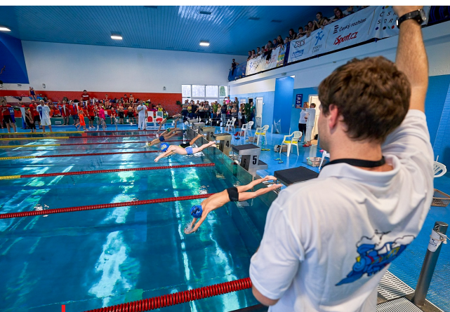
Bez pomoci vlády nebo Ministerstva průmyslu a dopravy ČR čeká provozovatele bazénů přetěžká sezona

„Česká unie sportu už využila bezpočet možností pro jednání s Národní sportovní agenturou, Ministerstvem financí ČR i zástupci obou komor parlamentu, aby se tato extrémně nízká podpora státu do sportu navýšila - dosud však neúspěšně. Zatím to prostě nikomu nevdává. Nezbyvá než věřit, že význam role pravidelného pohybu a sportu pro